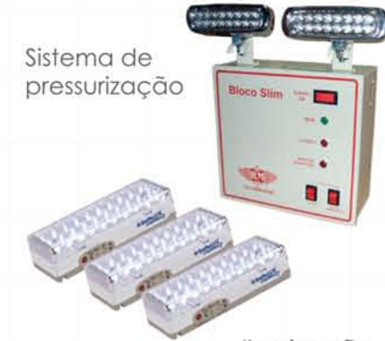
Iluminação de emergência