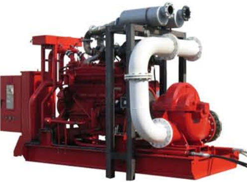
Bombas elétricas e à diesel