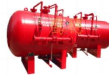
Sistema de geração de espuma