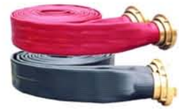
Mangueiras de incêndio